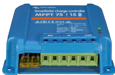
Contrôleur de charge SmartSolar MPPT 75/15